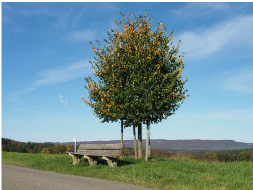
Nebeneinander von Landwirtschaft, Natur und Freizeitnutzung