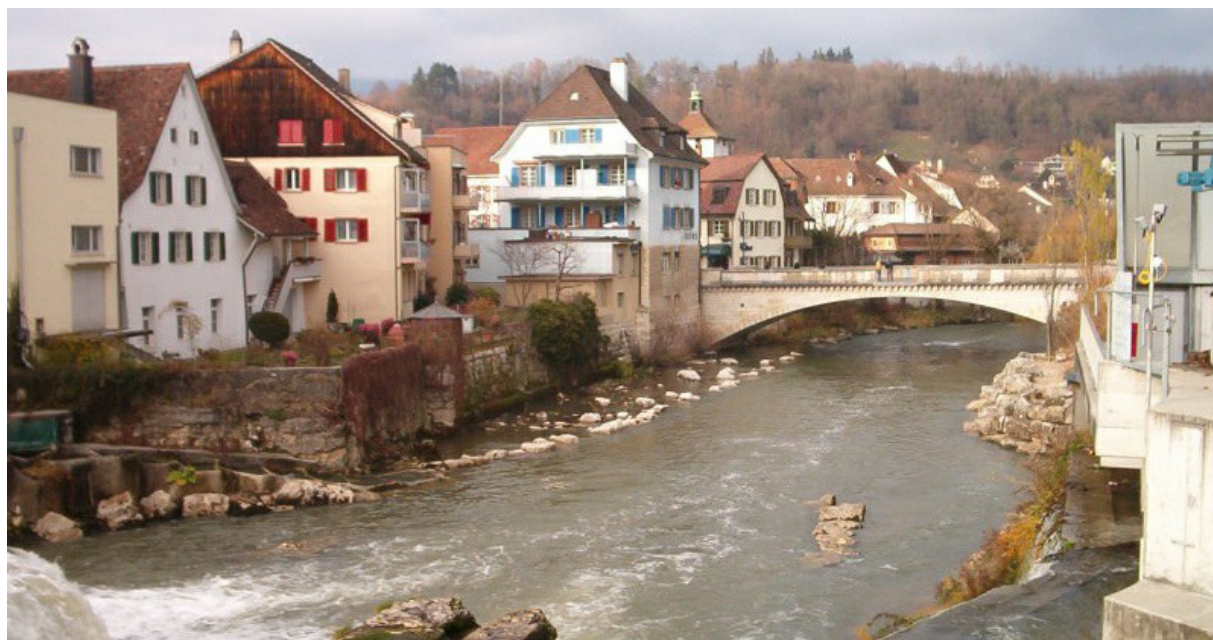
In Laufen grenzen Wohnen und Gewässerraum unmittelbar aneinander