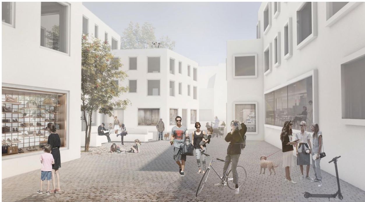
Visualisierung der möglichen Neugestaltung des Alten Postplatzes