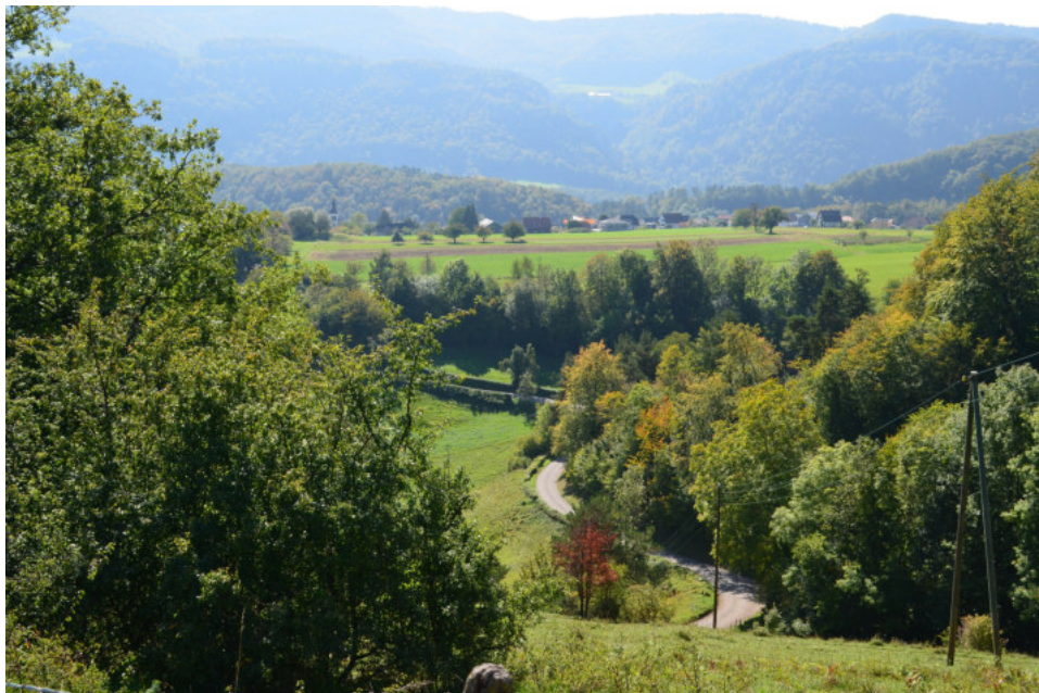
Nebeneinander von Landwirtschaft, Natur und Freizeitnutzung