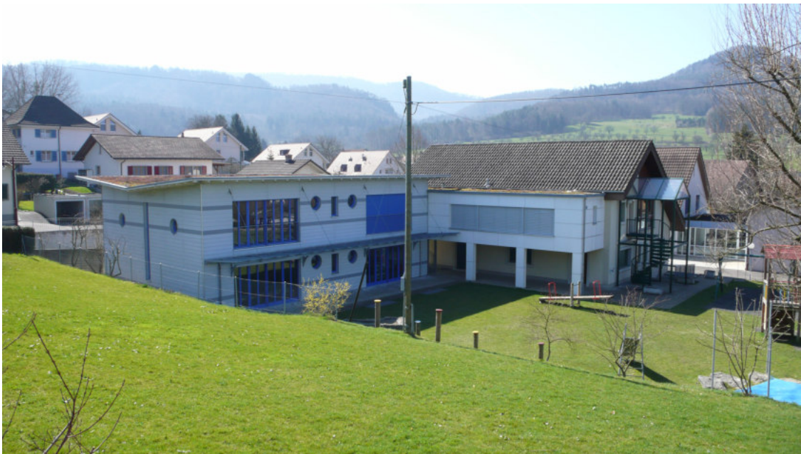
Ein öffentliches Gebäude