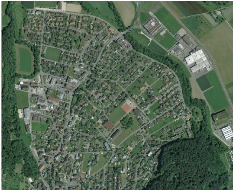
Das Quartier Sappeten

Der neue Plan berücksichtigt die vorbestandene, bewährten Grundsätze, sowie die häusliche Nutzung des Bodens und passt sich zugleich den heutigen rechtlichen und räumlichen Rahmenbedingungen an. So werden die Grundlagen zur Realisierung von Trottoirüberfahrten geschaffen, der Querschnitt der Krummackerstrasse mit Blick auf die künftige Fussgängerführung überprüft und die bestehenden Waldbaulinien in den Plan integriert. Die Abstände werden reduziert.