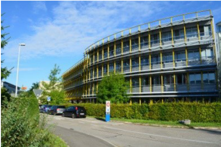
Eine punktuelle Verdichtung wird möglich

Arlesheim ist als Wohngemeinde wie auch als Standort für Unternehmen gleichermaßen beliebt und verfügt im gesamten Siedlungsgebiet über einzigartige Qualitäten, welche im Rahmen der Ortsplanungsrevision gezielt erhalten und entwickelt werden. Entlang der bestens mit dem öffentlichen Verkehr erschlossenen Hauptachse werden die Voraussetzungen für die Schaffung von zusätzlichem attraktivem Wohnraum geschaffen. Für zukünftige Entwicklungsgebiete gewährleistet eine Quartierplanpflicht eine qualitätsvolle Bebauung. Auch im Gewerbegebiet ist gegenüber den bisherigen Vorschriften an dafür geeigneten Standorten eine Mehrnutzung möglich. Mit der Einführung der Grünflächenziffer wird auch bei einer Siedlungsentwicklung nach Innen sichergestellt, dass das charakteristische grüne Erscheinungsbild der Gemeinde erhalten bleibt.