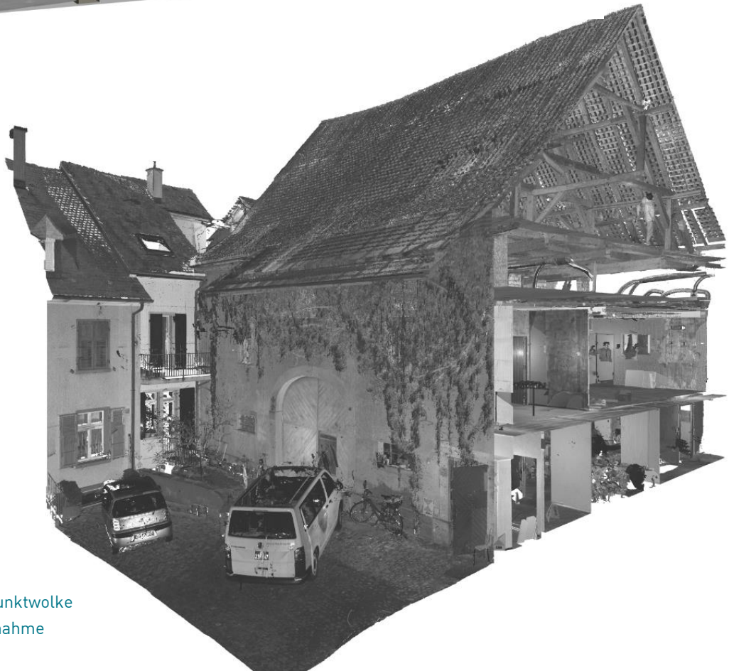
Ansicht auf die Punktwolke der Bestandsaufnahme