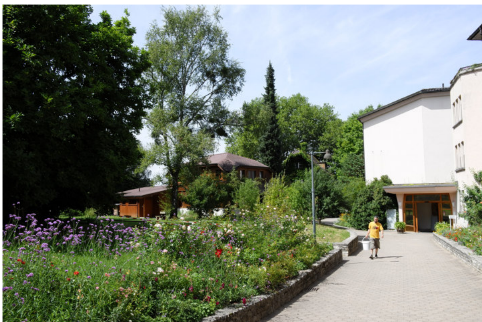
Der Park heute

Die Klinik Arlesheim, ein wichtiger Arbeitgeber und Grundversorger in der Region, erhöht ihre Kapazitäten durch einen Neubau. Das Areal liegt zentral im Dorf, umgeben von anderen, zum Teil sensiblen Nutzungen, und verfügt selbst über einen wertvollen Park. Die sich daraus ergebenden Anforderungen wurden mittels einer Testplanung und einer städtebaulichen Studie erörtert. Darauf aufbauend konnten schlanke Quartierplanvorschriften formuliert werden, welche einen Wettbewerb oder einen Studienauftrag verlangen. Ein Wettbewerb wird nach Abschluss der Quartierplanung durchgeführt. Eine besondere Stärke der Quartierplanung besteht darin, dass der bestehende Park ungeschmälert erhalten werden kann. Dank der gleichzeitigen Planung des Gemeindesaals konnte eine gemeinsame Lösung für die Parkierung gefunden werden.