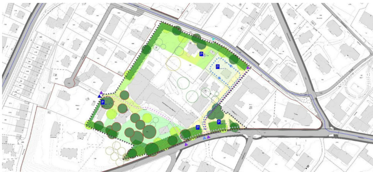
Erhaltung des Parks im Rahmen der Quartierplanung