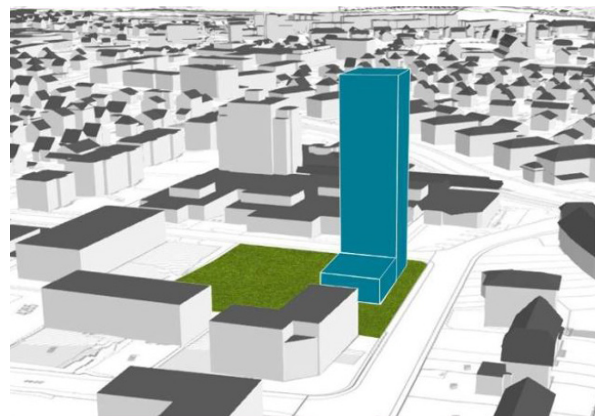
Schema des Flächenverbrauchs eines Hochhauses