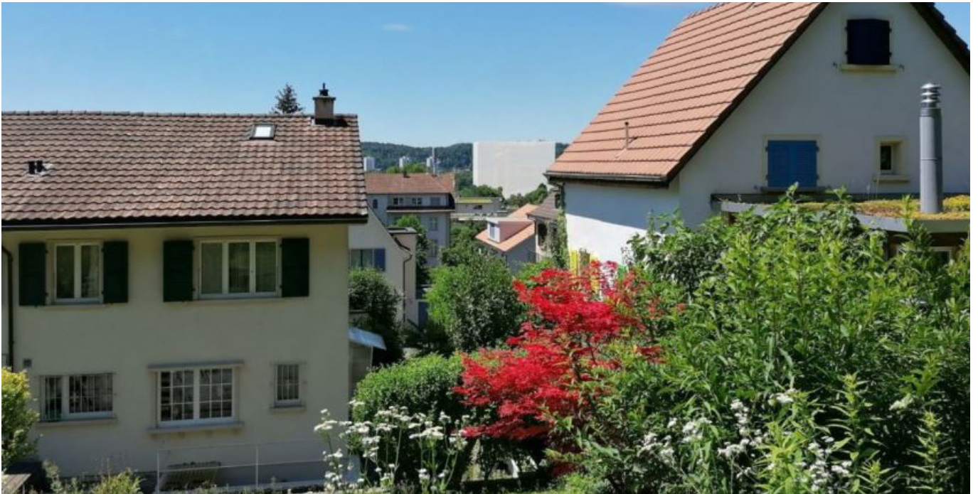
Visualisierung eines 60m Hochhauses im Möglichkeitsraum

Im Rahmen des Hochhauskonzepts Arlesheim wird die Gemeinde in verschiedene Räume nach Ausschluss- oder Eignungskriterien geteilt. Die Beachtung des gemeindeübergreifenden Kontexts und durch die Überprüfung aller städtebaulichen und raumplanerischen Kriterien, entsteht ein sorgfältig erstelltes Konzept, das dem aktuellen Thema gerecht wird.