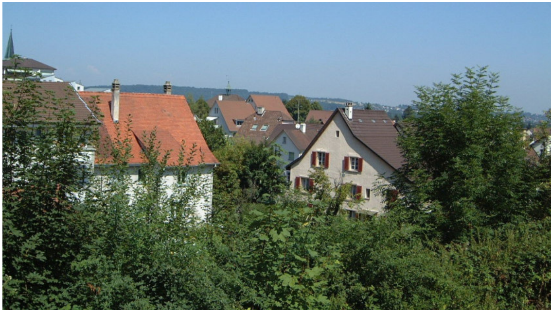
Im Dorfkern stehen Anpassungen der Zonenvorschriften an