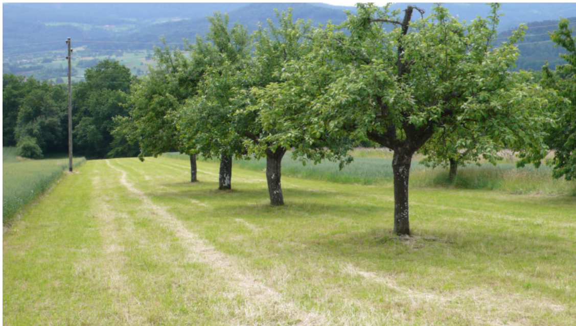
Hochstammobstbäume prägen die Landschaft